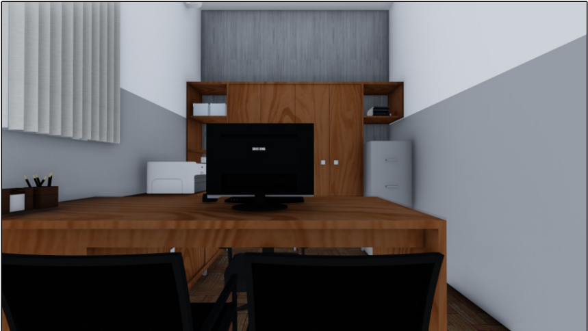
PERSPECTIVA 01 SEM ESCALA