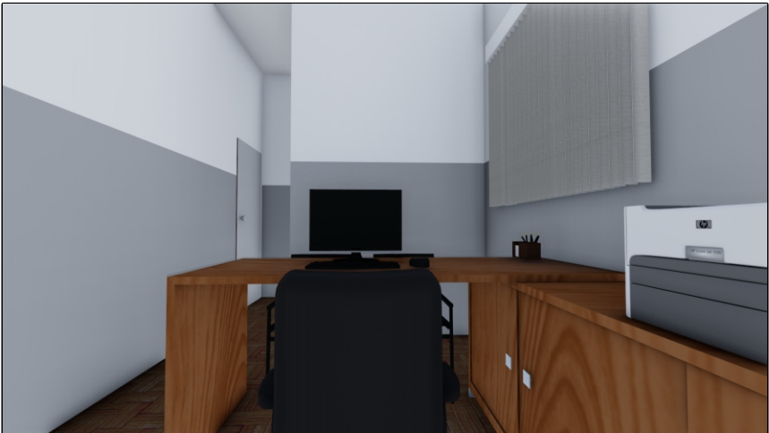
PERSPECTIVA 03 SEM ESCALA