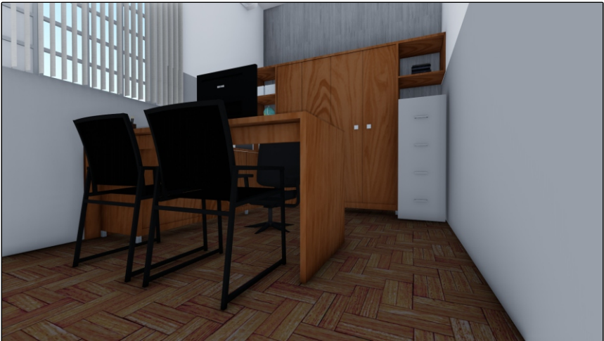
PERSPECTIVA 02 SEM ESCALA